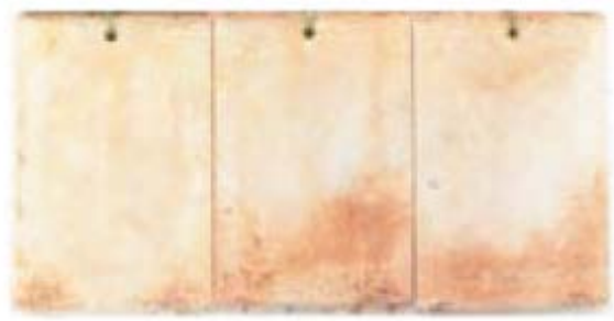
Galvanisation à chaud 10000 heures

ROUILLE : AUCUNE - RÉSULTAT 10 CLOQUE : AUCUNE - RÉSULTAT 10